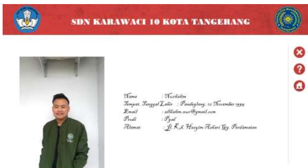
Gambar 1. Tampilan media pembelajaran yang dikembangkan

Hasil penelitian dan pengembangan ini adalah media pembelajaran menggunakan multimedia interaktif lectora inspire yang diterapkan pada pembelajaran PPKn materi keberagaman budaya. Gambar 1 adalah cuplikan dari hasil media pembelajaran menggunakan multimedia interaktif lectora inspire yang dikembangkan.