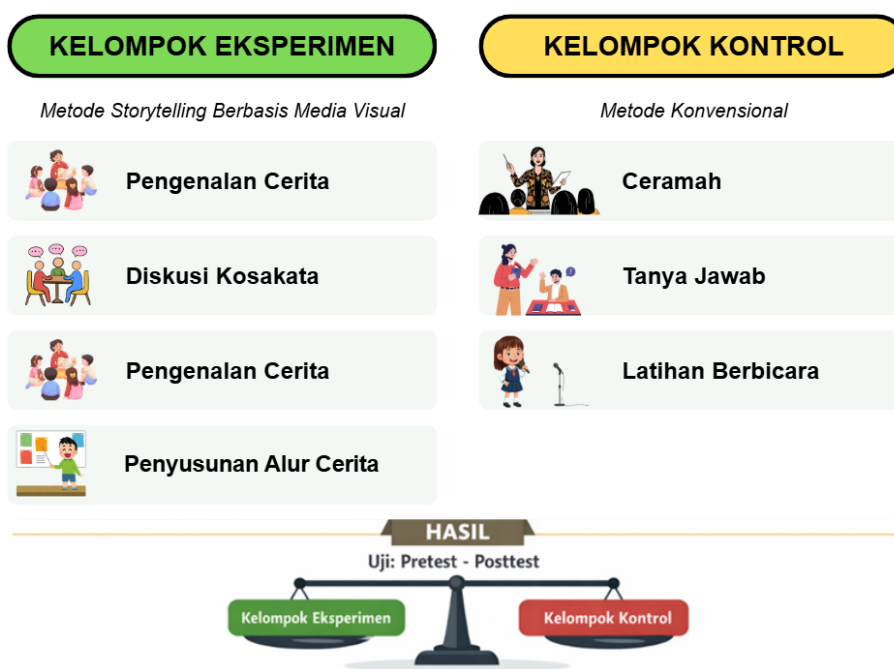
Gambar 1. Prosedur Kegiatan Masing-masing Kelompok Kelas

Prosedur kegiatan pada masing-masing kelompok dapat dilihat secara visual pada gambar berikut: